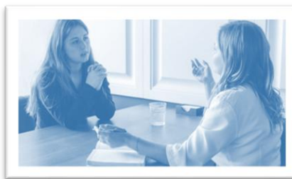
Stress sensitieve hulp